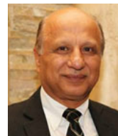
Léo Ziadé Invest Gain