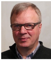
Jean-François Lavigne M.Arch O.A.Q. Zaraté + Lavigne Architectes inc.